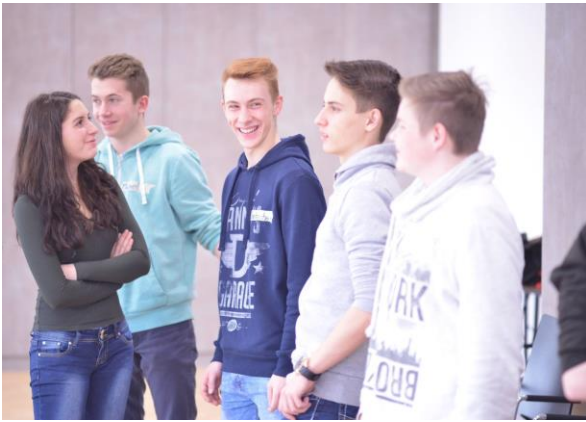
Teilnehmer/innen bei der Übung So viele wie möglich