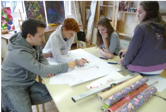
Kleingruppenarbeit zur Übung Gestrandet