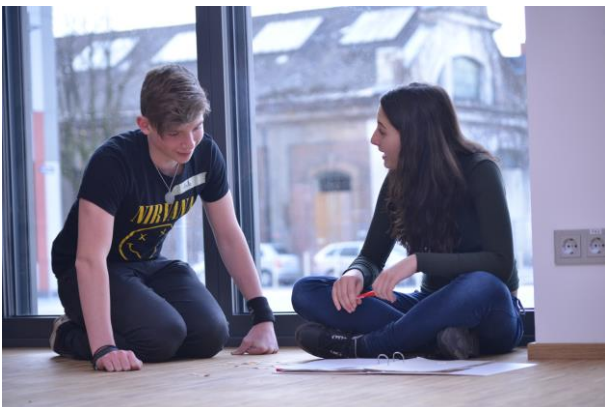
Kleingruppen-Arbeiten und Team-Building