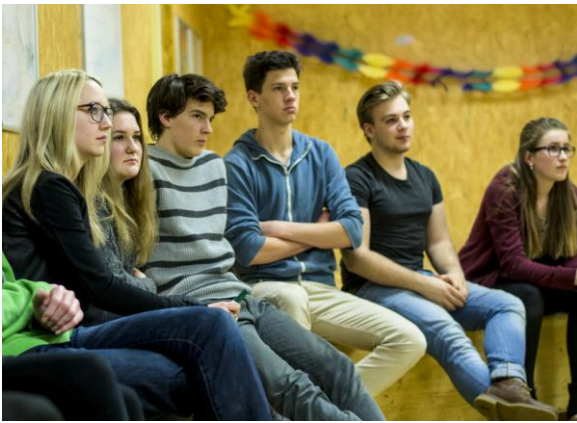
Vielfältige Inputs und Einbindung von aktuellen Themen